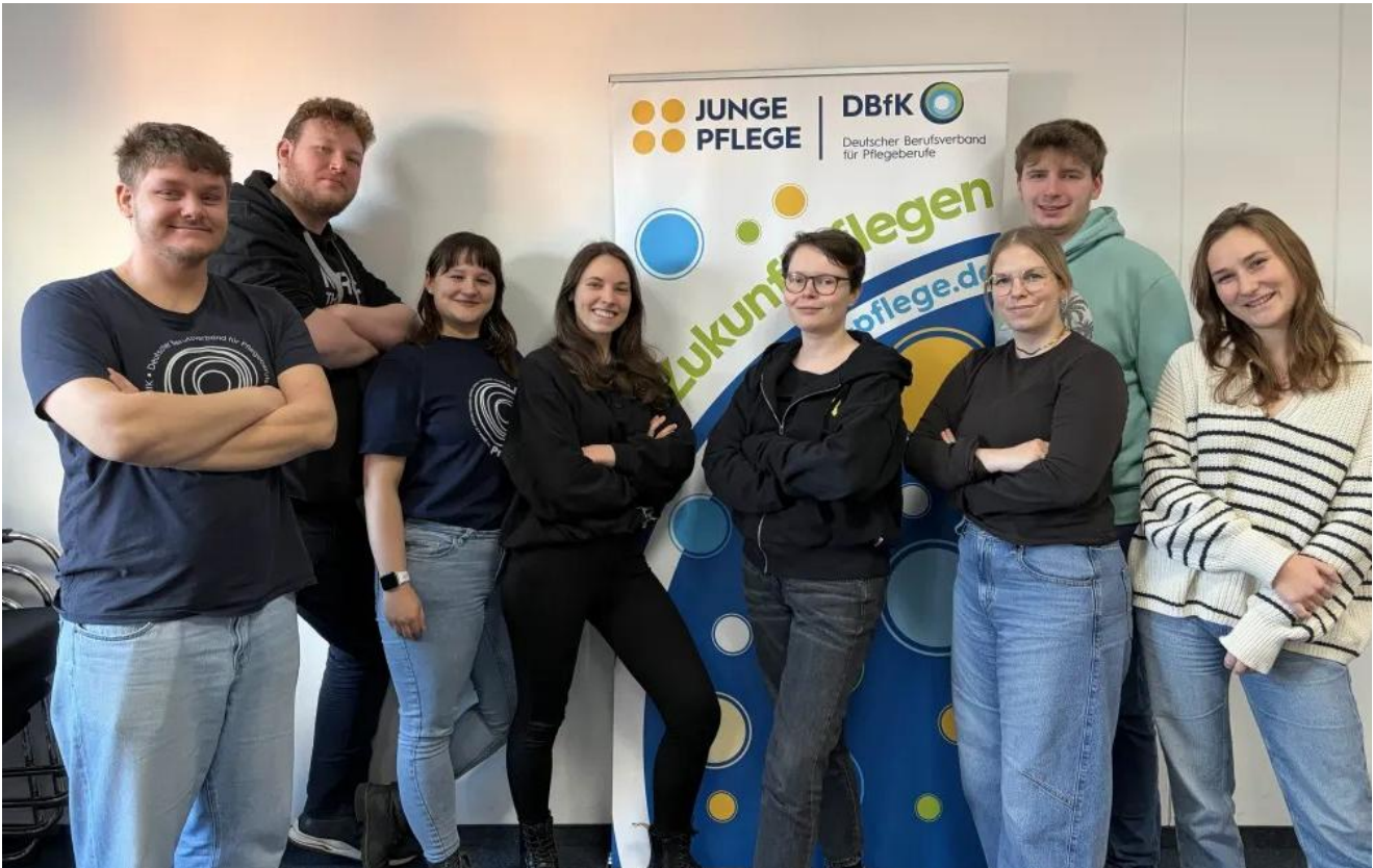
Die Lenkungsgruppe Junge Pflege erwartet euch im Oktober zum Forum Junge Pflege in Berlin.

Die Lenkungsgruppe Junge Pflege im DBfK bereitet ein tolles Programm vor. Was euch alles erwartet, erfahrt ihr bald hier im Magazin – oder folgt uns einfach auf Instagram.